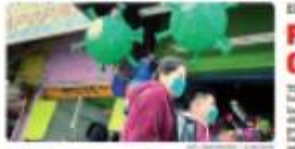
TEJUALA. Piden autoridades no bajar la guardia por que el Covid19 sigue siendo una amenaza real.